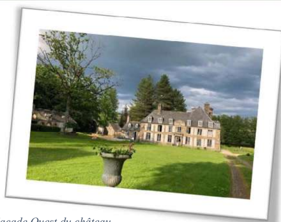
Façade Ouest du château