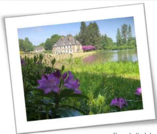
Façade Sud du château