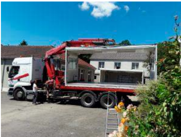
Arrivée du mobil home.