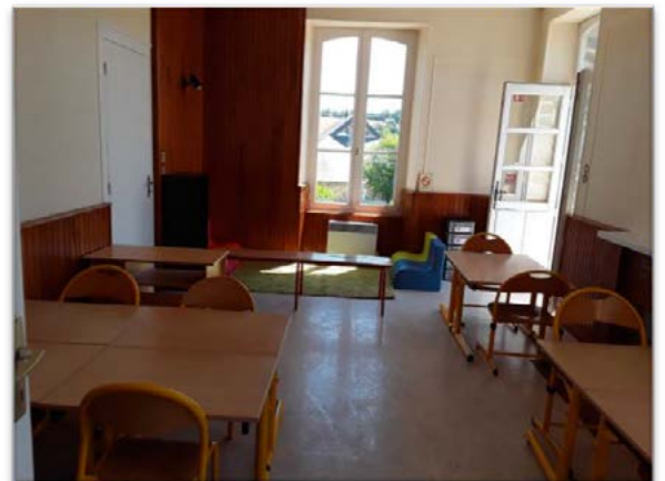
La classe des petits dans l'ancienne salle de conseil